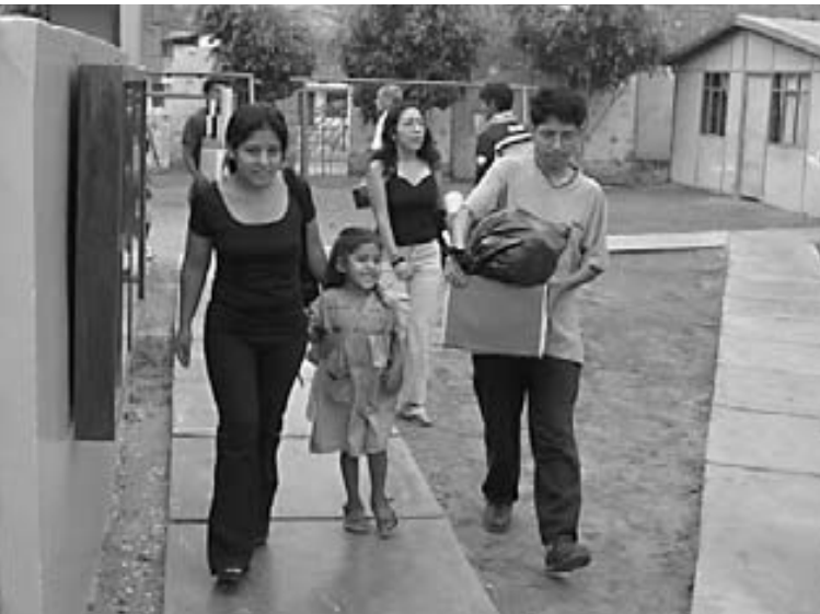
Premier jour de classe. Les enfants utilisent maintenant un petit tablier et un t-shirt, qui évitent d'abîmer les habits de la famille.

Pour la première fois depuis la création de TANI, 30% des parents ont indiqué qu'ils désiraient inscrire leur enfant, non pas seulement pour l'alimentation et les soins, mais pour «que l'enfant apprenne». Les choses changent lentement, ceux qui savent que nous ne laisserons jamais de côté les soins essentiels, ont aussi réalisé que grâce à l'éducation que nous donnons, leur enfant en saura plus et qu'il pourra changer son destin dès le départ.